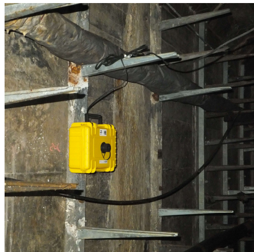
トンネル内での取付けの様子 (写真は旧装置)